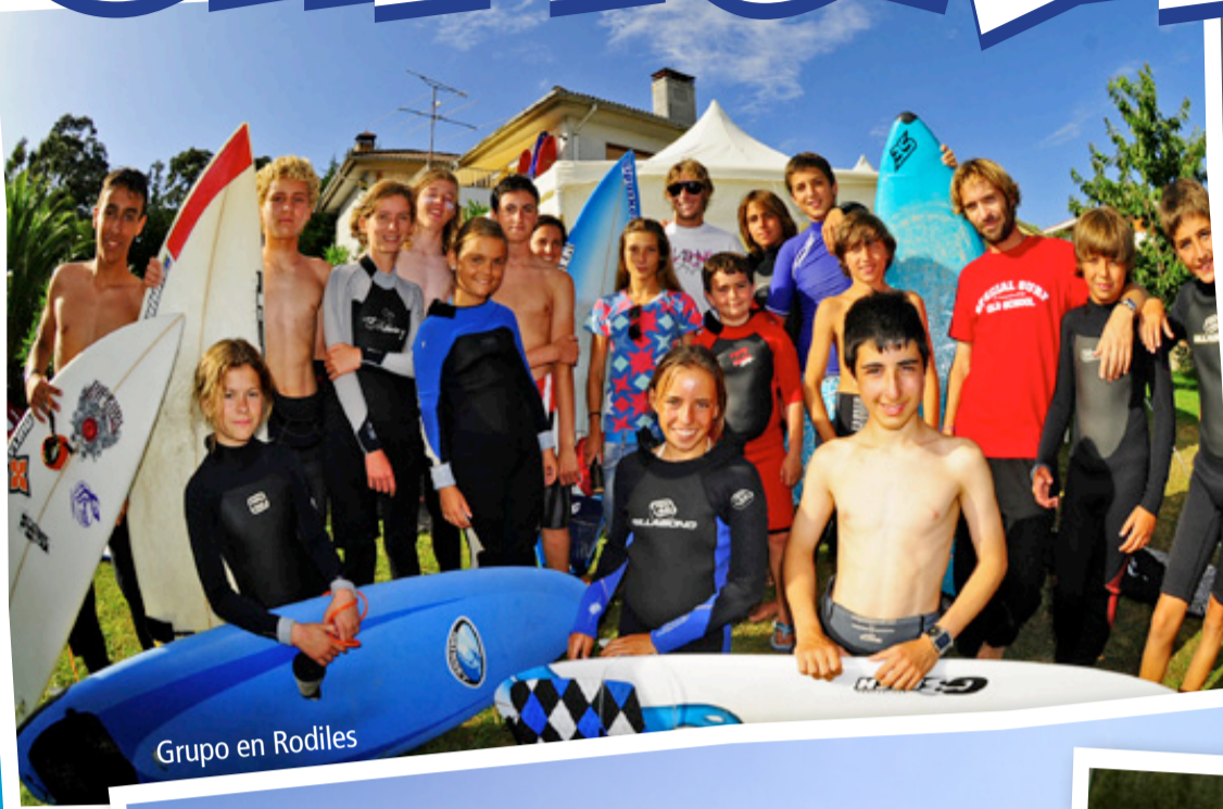
Grupo en Rodiles