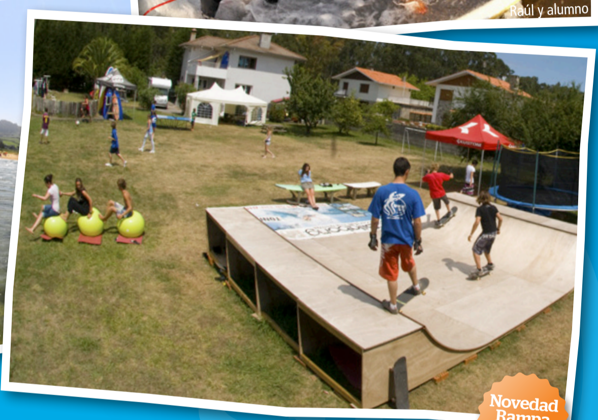
Novedad Rampa Skate